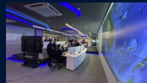
Big Data Analytics