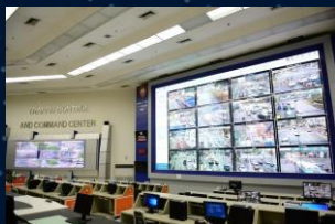
Traffic Control Centre